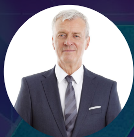
Santa Clara /CEO

畢業於澳大利亞國立大學，獲得電腦科學與工程碩士學位，是一名高級軟體開發工程師，有8年的軟體開發經驗。臉書全球駭客馬拉松的決賽選手。之前曾在臉書遠征公司、搜索指標公司工作，負責機器學習模型培訓專案、雲遷移和使用PWA技術的重構。